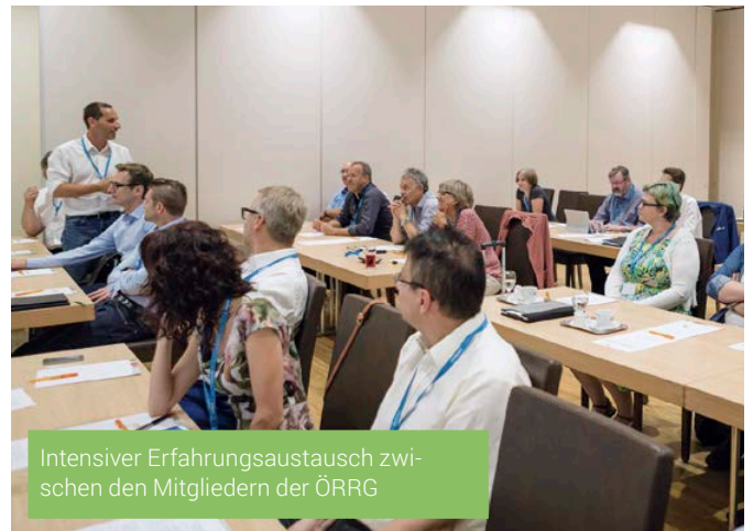
Intensiver Erfahrungsaustausch zwischen den Mitgliedern der ÖRRG