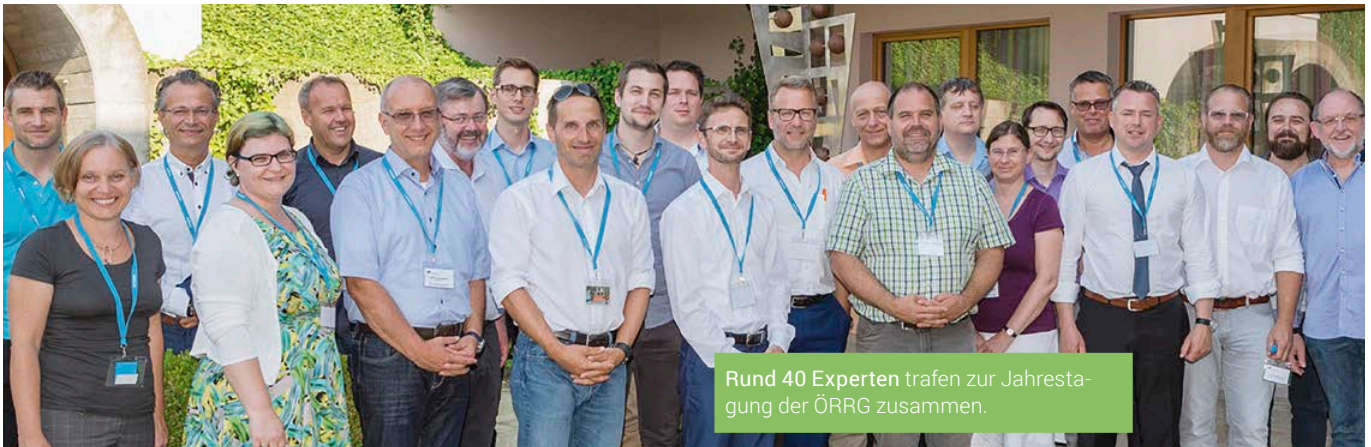
Rund 40 Experten trafen zur Jahrestagung der ÖRRG zusammen.

Tagung der Österreichischen Reinraumgesellschaft —