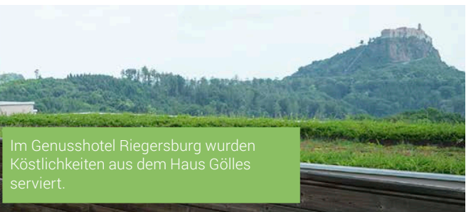
Im Genusshotel Riegersburg wurden Köstlichkeiten aus dem Haus Gölles serviert.